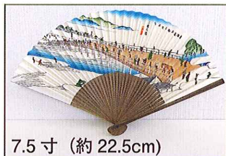
7.5 寸 (約 22.5cm)

東海道の東西の出発地である「江戸日本橋」と「京都三条大橋」の浮世絵をモチーフにした末広がり縁起の良い扇子です。京都の扇子職人の手によって、木版刷りで1本1本丁寧に作り上げた逸品です。夏の実用使いだけでなく、専用の扇子台(別売)を用いて、飾り扇子としてもご使用いただけます。「浮世絵扇子」でこの当時の風を感じてみませんか？